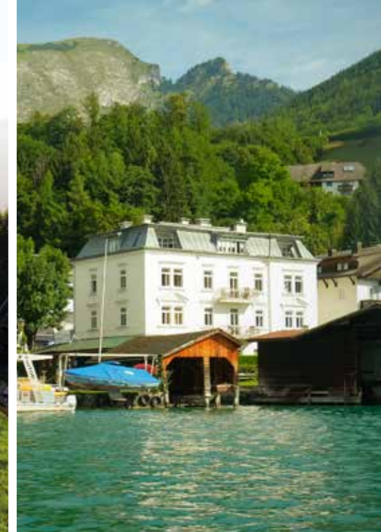
Residenz am See