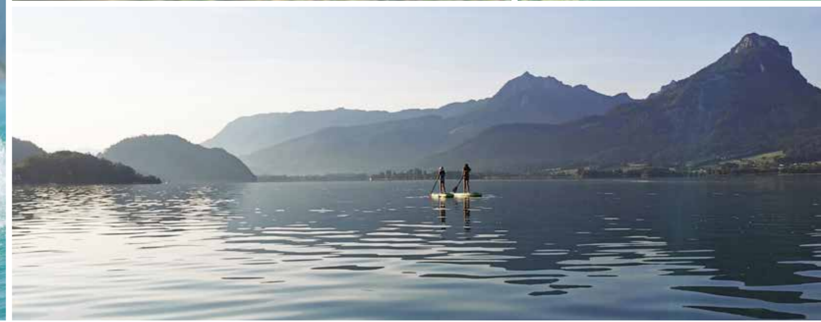
Frühling & Sommer